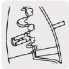
Cuchillas para zapatas