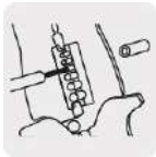
Pela cable de cobre y aluminio