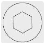
Entrada para llave allen