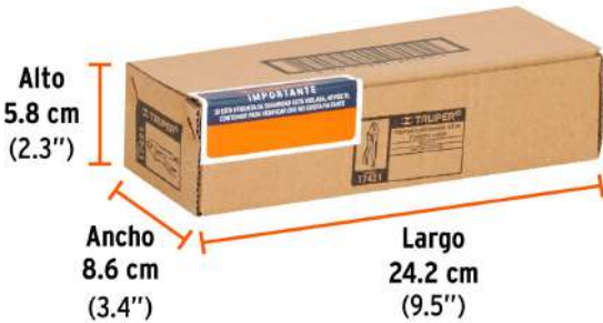
Contiene: 3 piezas