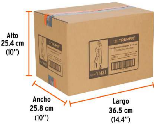
Contiene: 16 inner (48 piezas)