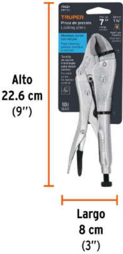
Peso: 0.33 kg (0.7 lb)