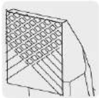
Mordazas con moleteado cruzado